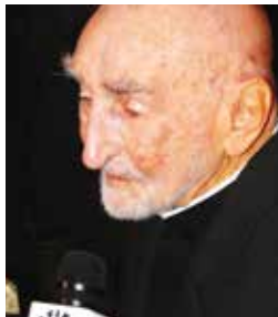
24/12 Pe. Bariani (101) Trindade/Paróquia