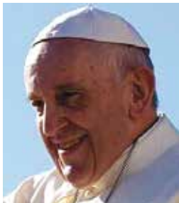
17/12 Papa Francisco (81)