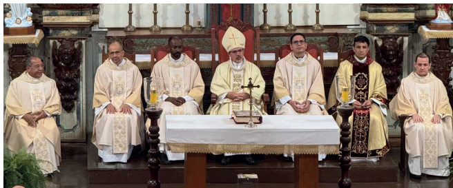
Missa de posse em Chapada dos Guimarães (MT)

À luz do nosso carisma e do Plano Apostólico, somos chamados a buscar constantemente novas formas de pregar o Evangelho e, ao mesmo tempo, renovar com fidelidade criativa aquelas frentes missionárias que já existem.