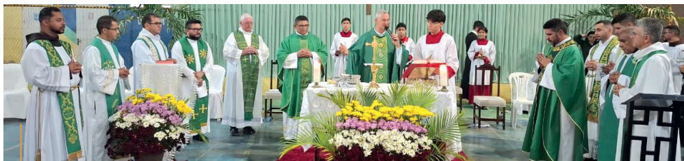
Missa de posse em Independência (CE)